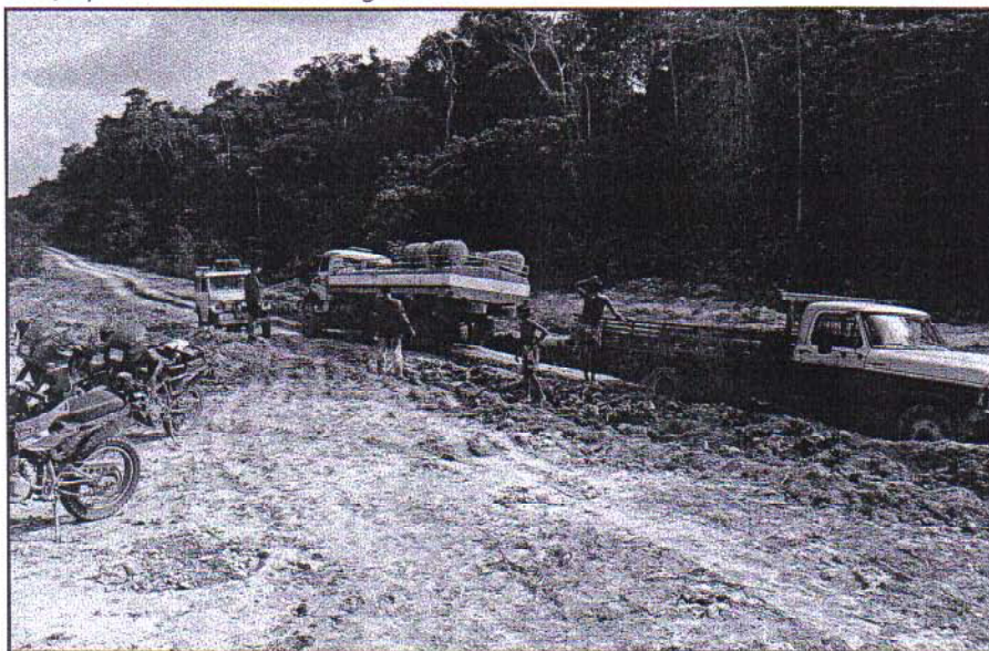
In het regenseizoen hebben de vrachtwagens 6 a 8 weken nodig om de BR 163 te rijden.

laten rijden en eventueel hulp te bieden. Het was achteraf allemaal niet nodig, maar toch dienden wij als proefkonijnen- wij zijn vermoedelijk eerste Nederlanders en wellicht Europeanen die de BR 16 bedwingen en enige conclusies te trekken. Zoals het feit dat de BR 16 in het regenseizoen levensgevaarlijk en onverantwoord is. Gidsen die het gebied op de motor door en door kennen zijn onontbeerlijk, net als een uitstekend uithoudingsvermogen want anders loop je grote risico's. Een dokter is in de wildernis echt niet aanwezig. Een arts meenemen is zeker het overwegen waard. Een absolute must is degelijke beschermende kleding en schoeisel. Een andere gulden regel is steeds het gezelschap te delen met een 4X4 die voorzien is van alle uitrusting en een goedwerkende lier. En last but not least: onderschatting is de grootste flater die je kan maken.