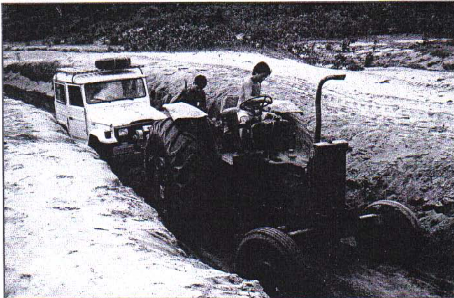
Diepe sporen kunnen kilometers lang zijn. Zonder hulp kom je er niet doorheen.