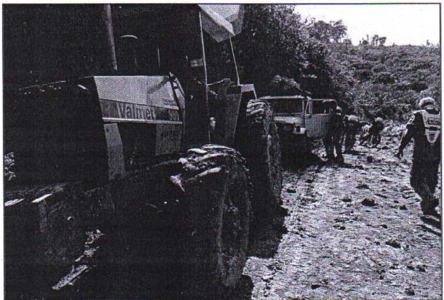
De Valmet-tractor heeft de volgjeep vele kilometers door de leemmodder gesleept.

Televisiebeelden hadden ons al laten kennismaken met de watermassa's die in de Jeeps stroomden tijdens de Camel Trophy in 1988. Tijdens onze ploetertocht door de modder, de sporen, de geulen en de plassen van de BR 163 lijkt de Camel Trophy van 1988 ons echter een makkie, vergeleken met de watermassa's die wij, zonder bescherming van het autoblik, als offroad rijders over ons heen krijgen als we met een behoorlijke stoot gas door een van de vele van tevoren onbepaalbaar diepe, glibberige, met water bedekte modderpoelen heen baggeren. Natuurlijk met behoorlijk wat gas erop, omdat, als je de situatie van tevoren verkeerd taxeert, je halverwege blijft steken met een volgelopen carburator en als het even tegenzit ook nog met motor en al omkiept. Sommigen gaan ervoor naar een duur exclusief kuuroord, wij echter krijgen regelmatig modderbaden gratis en voor niets.