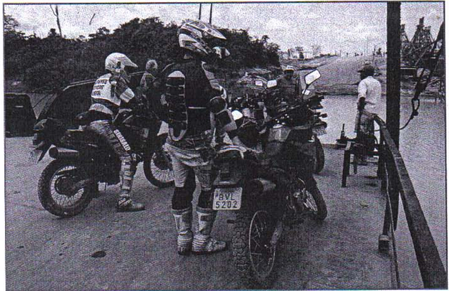
Met de veerpont over een van de vele rivieren in de Amazone

ting in de tropenduisternis en in de stromende regen, zo spoedig mogelijk te overbruggen om alles in veiligheid te brengen. Zwoegen geblazen dus, tot Juninho opeens een helder idee krijgt: enkele kilometers terug heeft hij een boerderijtje gezien waarin een enorme vierwielangedreven Valmet 980 traktor staat. Hij glibbert weg en duikt ruim een uur later terug op, begeleid door de traktor met chauffeur en hulpje. Het is inmiddels al na elven. De traktorchauffeur zegt onheilspellend dat we snel naar het volgende dorpje moeten zien te komen omdat we anders voor dagen vast zullen zitten. En hij kan het weten want hij verdient in het regenseizoen zijn brood uitsluitend met het lostrekken van eindeloze rijen vastgeraakte vrachtauto's. Dus ploeteren we verder door de zuigende modderpoelen en volgelopen geulen, nog steeds geteisterd door voortdurende stortbuien. We glibberen de helling op en dan zitten onze motoren,