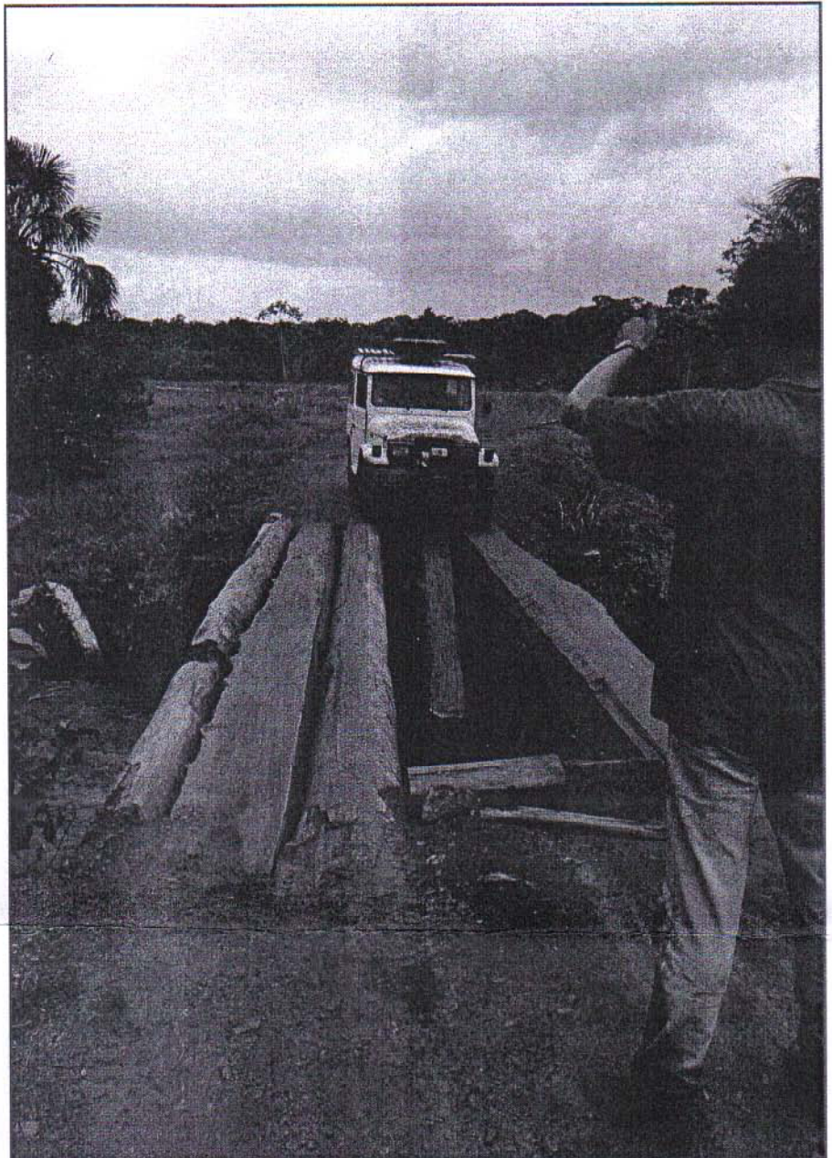
En zo bouwt men in Brazilië bruggen. Je kan maar beter een vaste hand hebben.

Op donderdagavond 21 oktober bereikten we Santarem, middenin het Amazonegebied, waar de directeur-eigenaar van Toekan Turismo, ons gastvrij en bloednieuwsgierig opwacht. Omdat ook hij ongerust was over onze reis, had hij reeds een sportvliegtuigje gecharterd om ons tegemoet te vliegen en tevens had hij een Jeep klaar staan om ons tegemoet te